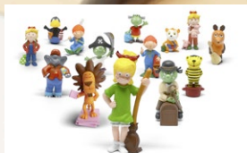
Rund 30 Tonies im Sortiment bis Ende 2016