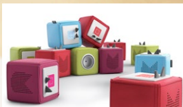
In den Farben Rot, Grün, Hellblau und Beere erhältlich