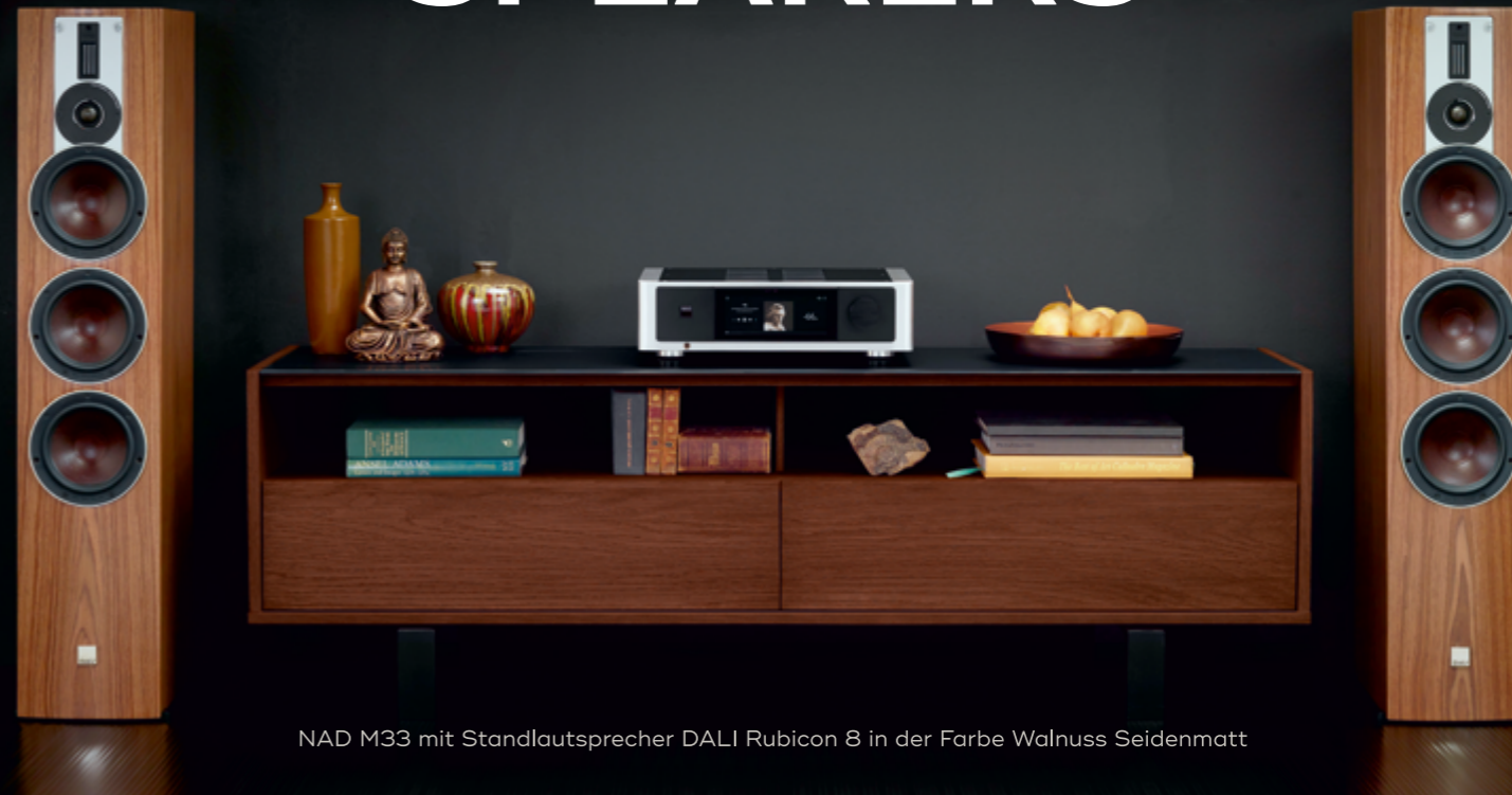
NAD M33 mit Standlautsprecher DALI Rubicon 8 in der Farbe Walnuss Seidenmatt