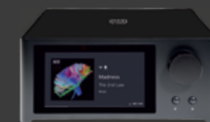
NAD C700** BluOS™ Streaming-Vollverstärker 1.499 €

Schöne neue Welt! Aus Telefon, Fotoapparat und MP3-Player wurde das Smartphone. Und aus dem HiFi-Turm der Streaming-Vollverstärker. „All in one“ heißt das Prinzip – alles in einem. Und für NAD zudem „Just add speakers“ – denn alles, was noch fehlt, sind die Lautsprecher. NADs neueste und klangvollste Streaming-Vollverstärker heißen M33, M10 V2 und C700. Alle drei haben den schon zigfach höchstgelobten BluOS™ Netzwerk-Streamer an Bord, mit dem sich vortrefflich etliche Streamingdienste und Radiosender aus dem Internet anzapfen lassen. Alle zeigen das, was gerade spielt, in ihrem großen Farbdisplay an und verfügen über Dauerpower satt – mit bis zu 2 x 200 Watt (modellabhängig). Und dann sind da noch die geniale Raumkorrektur DiracLive®, ein Surround-Modus für kabellosen Heimkino-Sound**, Steckplätze für optionale MDC-Module*** und vieles mehr. Just add speakers. Und die hat Ihr NAD Fachhändler zum Glück gleich mit im Angebot. Noch Fragen?