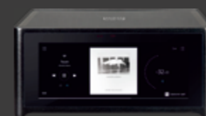
NAD M10 V2** BluOS™ Streaming-Vollverstärker 2.999 €