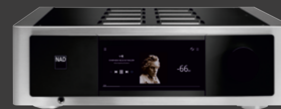
NAD M33*** BluOS™ Streaming-Vollverstärker 5.499 €